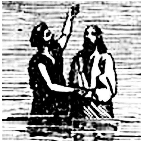
Veche gravură reprezentând botezul prin imersie

Cu ocazia acestei comemorări, în perioada 24-26 Iulie 2009 la Amsterdam (Olanda) au avut loc conferințe, seminarii și studii biblice moderate de lucrători baptiști din întreaga lume, evenimentul fiind organizat de către Alianța Mondială Baptistă în colaborare cu Federația Baptistă Europeană și Uniunea Baptistă din Olanda. Evenimentul a avut și scopul de a reaminti baptiștilor din întreaga lume cine sunt, care este identitatea lor și care sunt rădăcinile lor istorice.