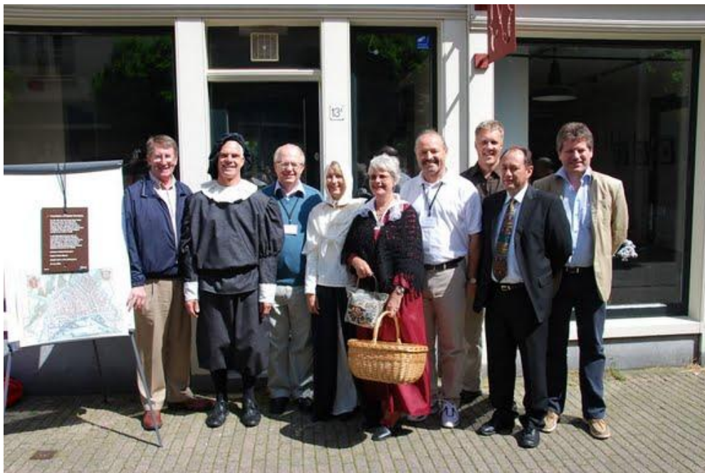
Pe Baker Street, la leagănul mișcării baptiste, cu ocazia evenimentului Amsterdam 400

și mișcarea baptistă are un inițiator. Acesta este John Smyth (1570-1612) și s-a născut în comitatul Lincolnshire din Anglia. A făcut studiile primare la Gainsborough (o localitate din același comitat), apoi a studiat teologia la Christ College în cadrul Universității Cambridge, unde și-a luat diplomele de licență și masterat în teologie. În 1594 Smyth a fost ordonat preot în biserica Angliei și ales în conducerea Christ College (facultatea de teologie a Universității Cambridge).