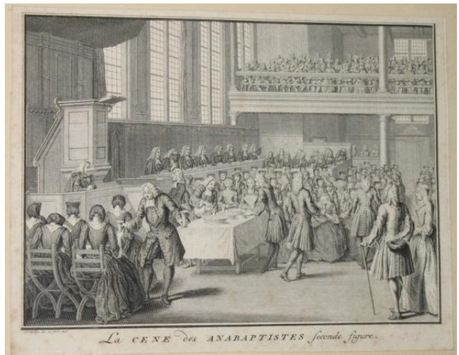
Gravură veche reprezentând anabapțiști la Cina Domnului

Creștinii bapțiști din lume au sărbătorit, între 24 iulie și 1 august, patru sute de ani de la înființarea primei biserici baptiste. Mișcarea a fost începută de un grup de puritani din Anglia, care s-au refugiat în Olanda, datorită persecuției religioase din țara lor. La Amsterdam au luat legătura cu o comunitate de credincioși menoniți care le-au permis să se întâlnească într-o brutărie pe care o dețineau. De aici mișcarea s-a extins în întreaga lume. În prezent sunt peste 100 de milioane de credincioși bapțiști pe glob. Comunitatea baptistă din România număra aproximativ 140 000 de credincioși (potrivit ultimului recensământ) și este activă în aproape toate zonele țării, prin cele 1700 de biserici și filiale. Uniunea Bisericilor Creștine Baptiste din România este instituția care reprezintă în fața autorităților interesele bisericilor locale.