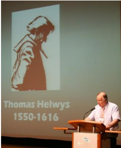
Aspecte de la Amsterdam 400